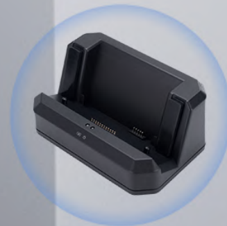
Estación de acoplamiento de carga