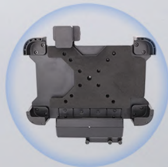
Montaje en vehículo