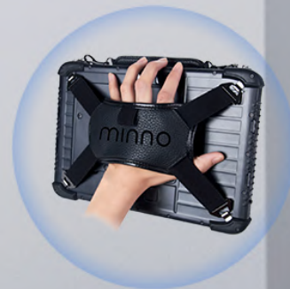
Correa de mano